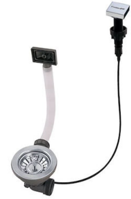
自动下水器 LIRA 8407 102