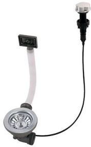
自动下水 8407 100